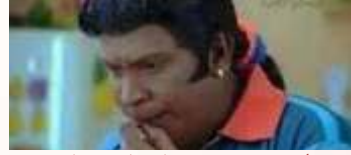
அப்ப கண்டிப்பா அறிவுதான் வளர்ந்து இருக்கும்.